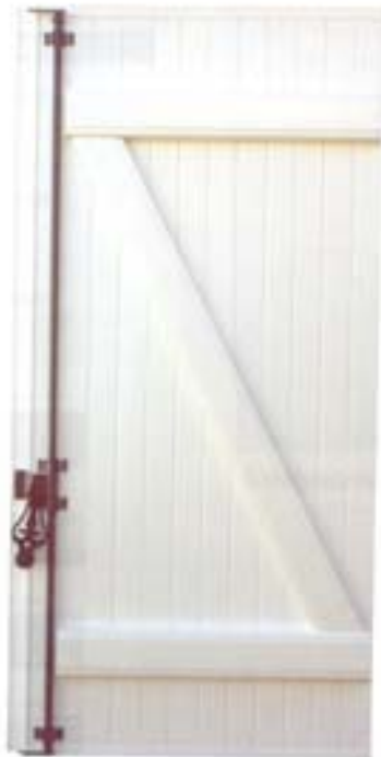
Barres et écharpes moulurées ferrage acier